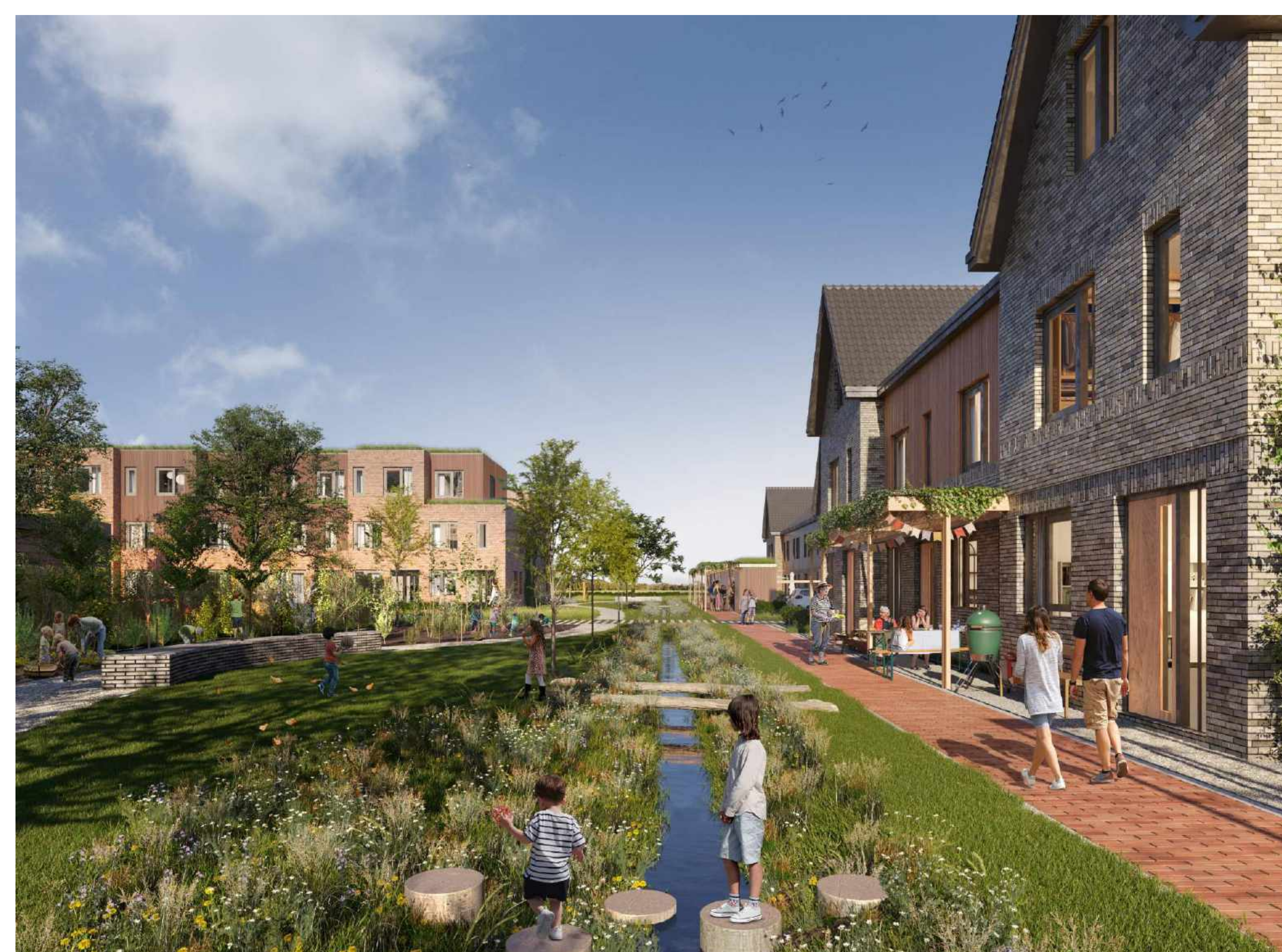
Hofwoningen (links) - Parkwoningen, Verandawoningen (rechts)