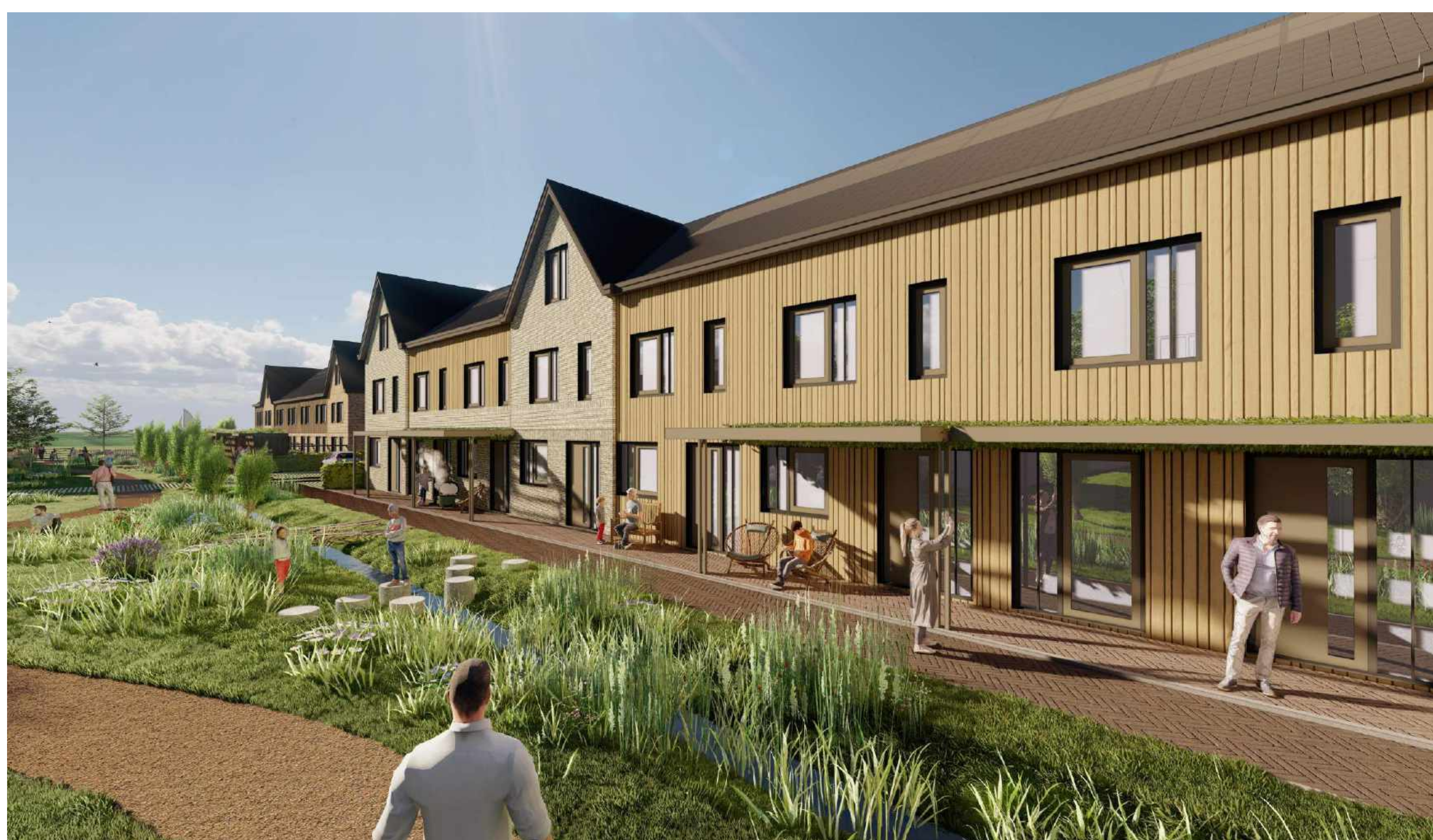
Parkwoningen (links) - Verandawoningen (rechts)